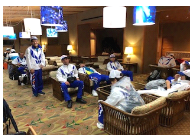
出発前のホテルロビーにて。眠気と緊張と。