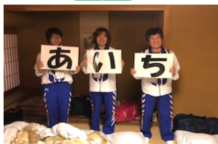
チームワーク抜群ですね