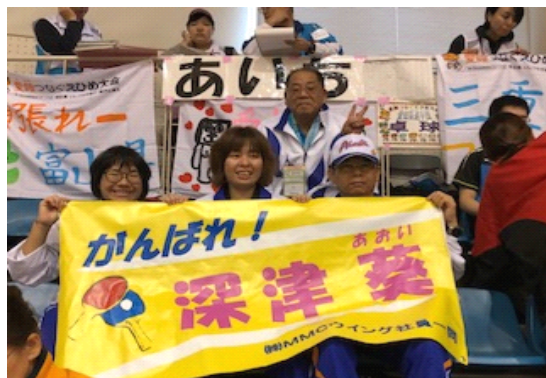
お母さんが作ってくれた横断幕