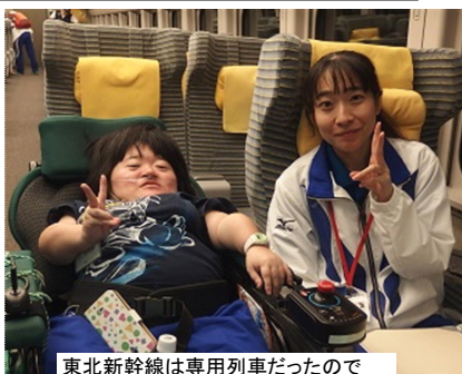
東北新幹線は専用列車だったので グリーン車での一んぶり

名古屋駅で家族とのしばしの別れにさみしい思いをしましたが 腹が減ってはなんとかで・・・ 東海道新幹線の車内では もってきたお菓子を分け合い 遠足気分。笑顔もみられいい感じ