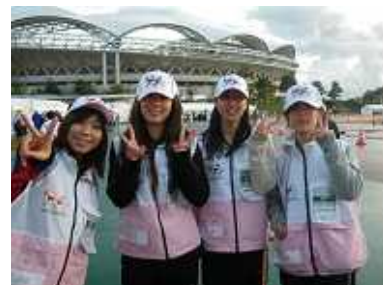
愛知県陸上担当のボランティアさん新潟医療福祉大学のみなさん。

この大会 何と言っても縁の下の力持ちは大会実施本部員さんとボランティア(サポーター)の学生さんたち。今回愛知県の陸上に付いてくれた学生さんは見目麗しい6人のお嬢さんたち。彼女たちいい動きしてくれています。毛布を大量に運んだり車いすを手配してくれたり・・・昨日よりも今日はずっと良かったし、明日は今日以上に。素直だし、笑顔はかわいいし。実施本部員さんも然り、こちらの気持ちを汲んでくれた動きをして下さいます。ありがとうございます。