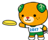
ニコニコの愛顔 選手かと思ったら 高木コーチでした ピンバッチ ありがとうございます