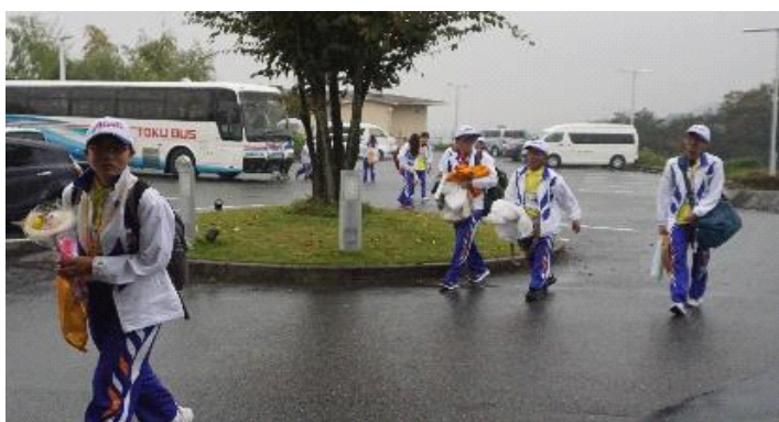
選手のみなさん おかえりなさい