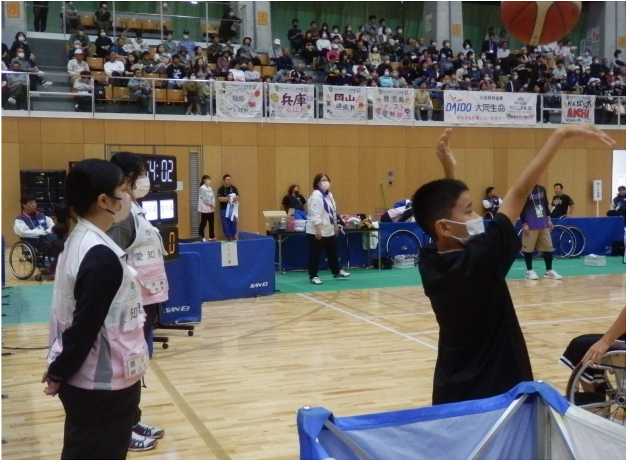
徐々に 試合モード 態勢に