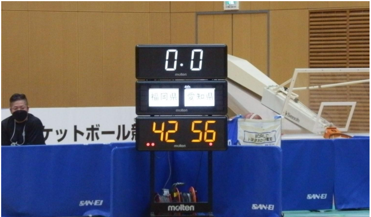
決勝前の3位決定戦を観戦