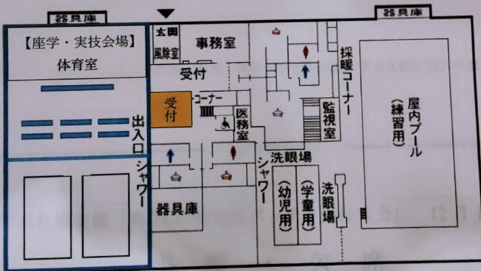
開始に先立ち 設営など準備が行われました