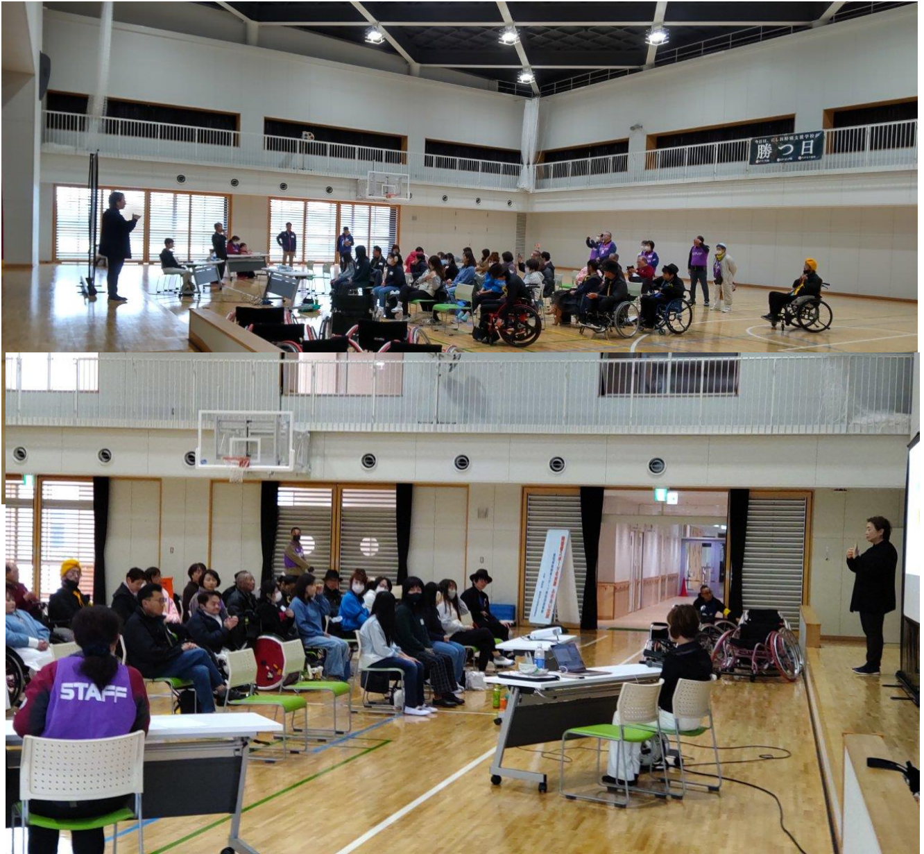
主催者あいさつ そして 講演会の始まり