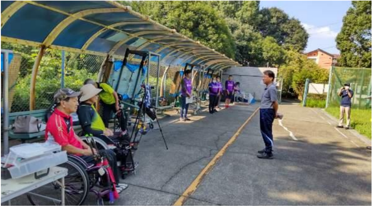
先程とは 一変 真剣勝負 競技の顔 姿 雰囲気になっていた