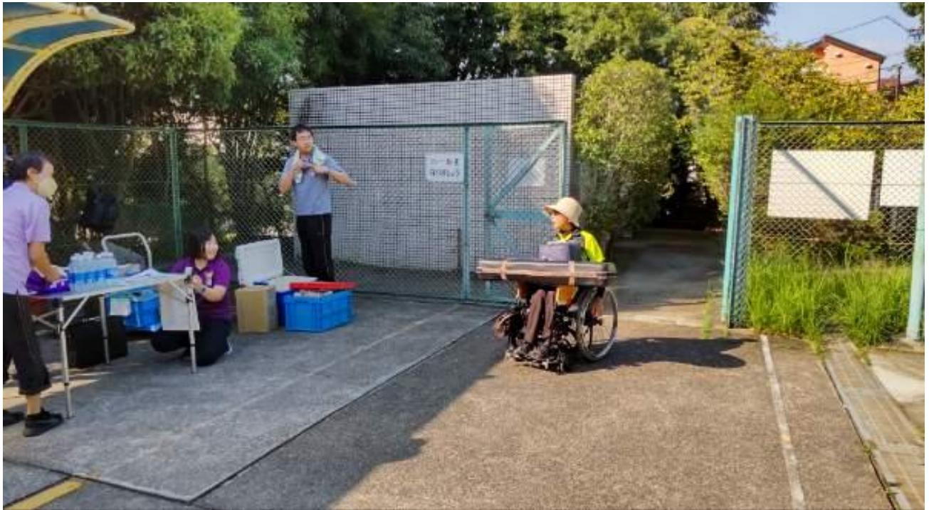
ベテランも 初めの方も 協力し合い 準備が進められた