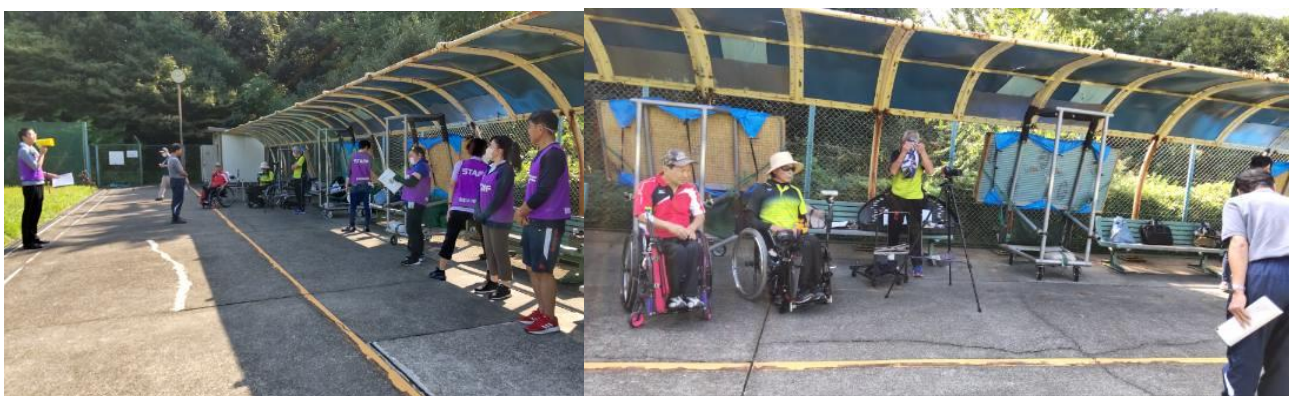
選手も役員も事務局も 入り乱れリラックス