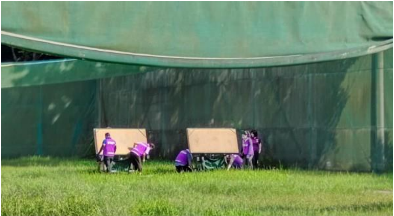
一段落 ひと息つく