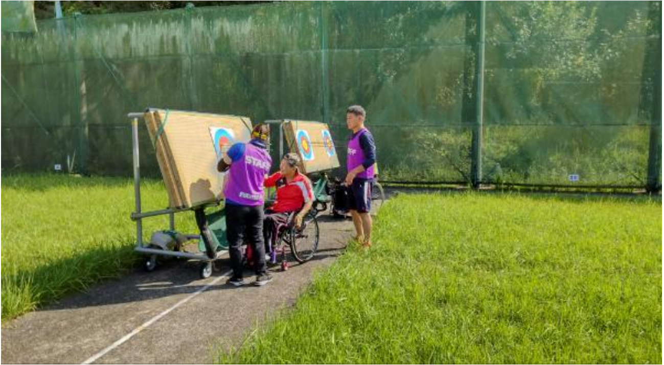
競技者が見守る中 役員 事務局 緊張の瞬間「矢取り」