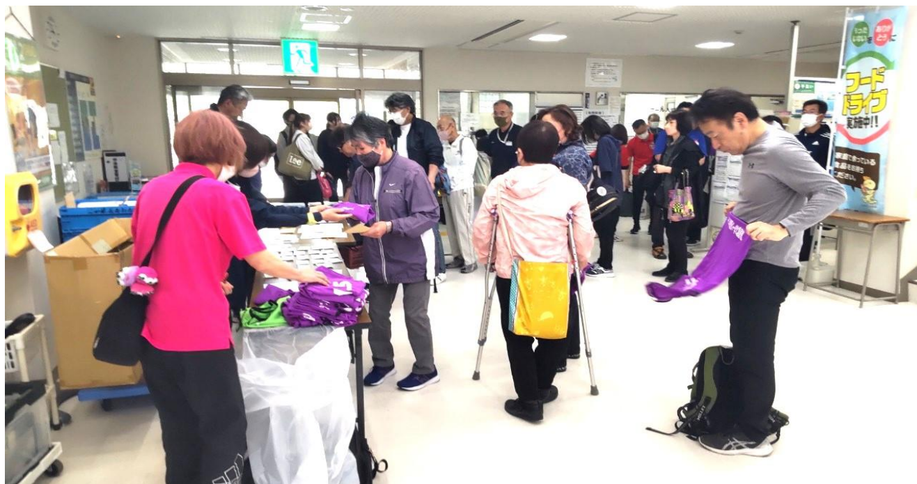
会場の体育室で スタッフ 全体打ち合わせ

早めに来られた競技者のご家族 支援の皆さんが スタッフの役割が機能するまでの間 状況を理解され 笑顔で待機 協力して下さるのが とっても嬉しかった