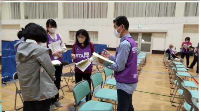
新しいスタッフにとっては 有意義な機会にもなります