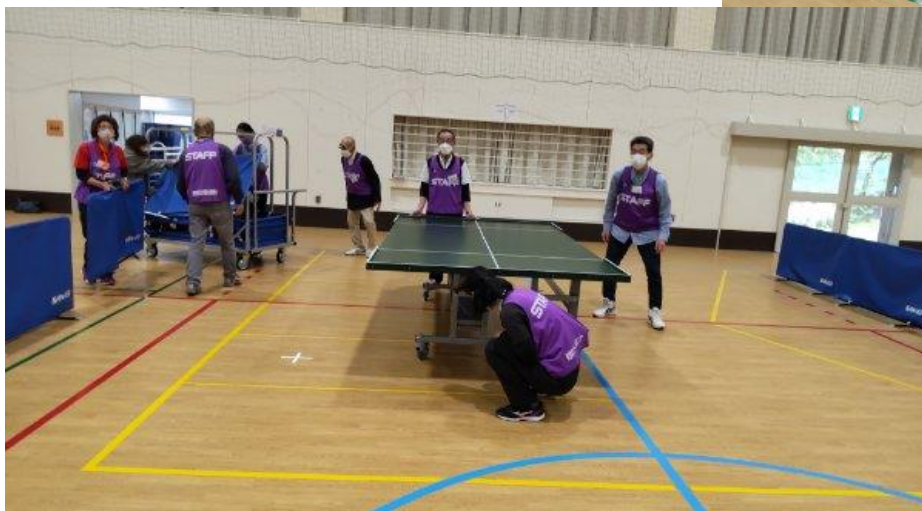
設営をしながら ルールの確認等も あわせて行いました