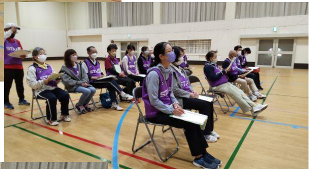
全体打ち合わせの後 会場設営を行いました